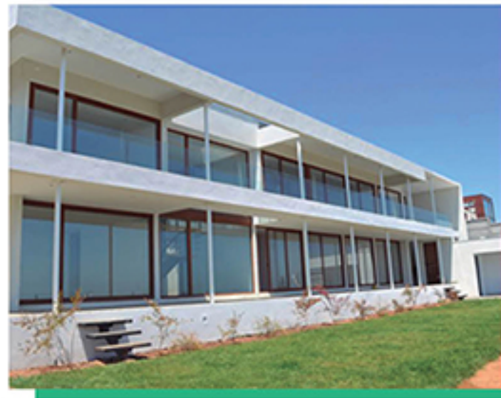
En Altolaquén, estupenda casa TOP nueva de estilo Mediterráneo

Amplia y lujosa casa seminueva. De 393m2 más salón habitable de 80 m2, construidos en 500m2 de terreno.