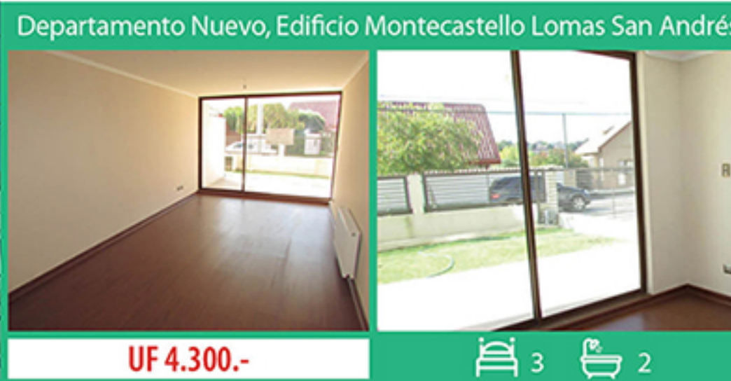
Departamento Nuevo, Edificio Montecastello Lomas San Andrés

Finas terminaciones, a pasos de Mall Plaza del Trébol. 116m2, cuenta con un estacionamiento