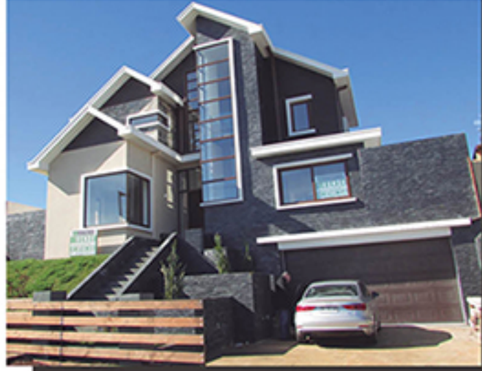
Casa TOP nueva y sin uso en El Venado, San Pedro de la paz

Muy fina logrado diseño hermosas panorámicas, en San Pedro de la Paz, 450m2 aprox, emplazada en aprox. 1.230m2 de terreno