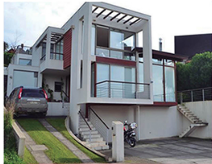
En Idahue, estupenda casa de estilo Mediterráneo.

Altos estándares constructivos, finas terminaciones, salón multipropósito Aprox. 352m2 en 429m2 de terreno.