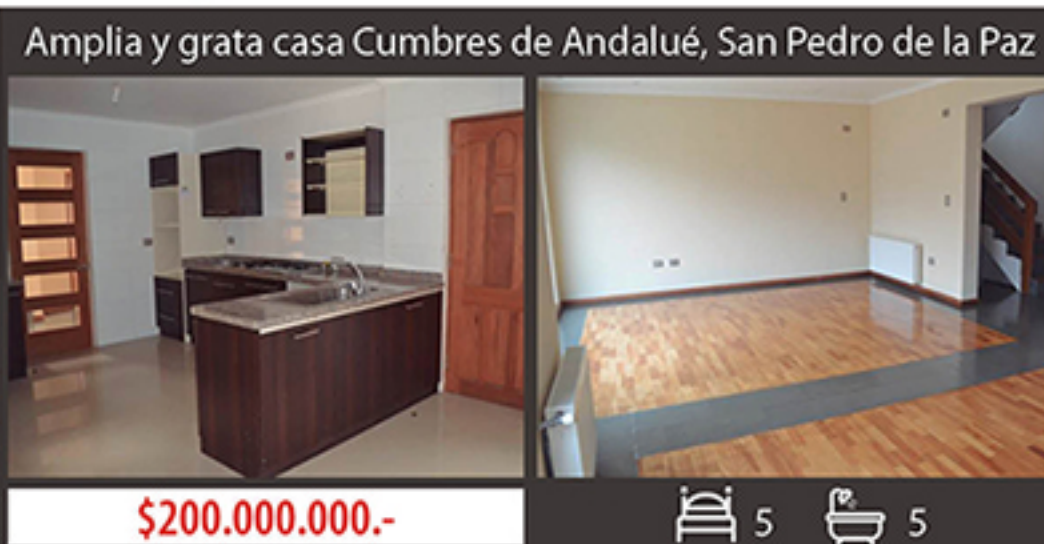
Amplia y grata casa Cumbres de Andalué, San Pedro de la Paz

Sólida y fina construcción de aprox 250mt2 construidos, emplazada en aprox 272m2 de terreno. Gran salon multipropósito