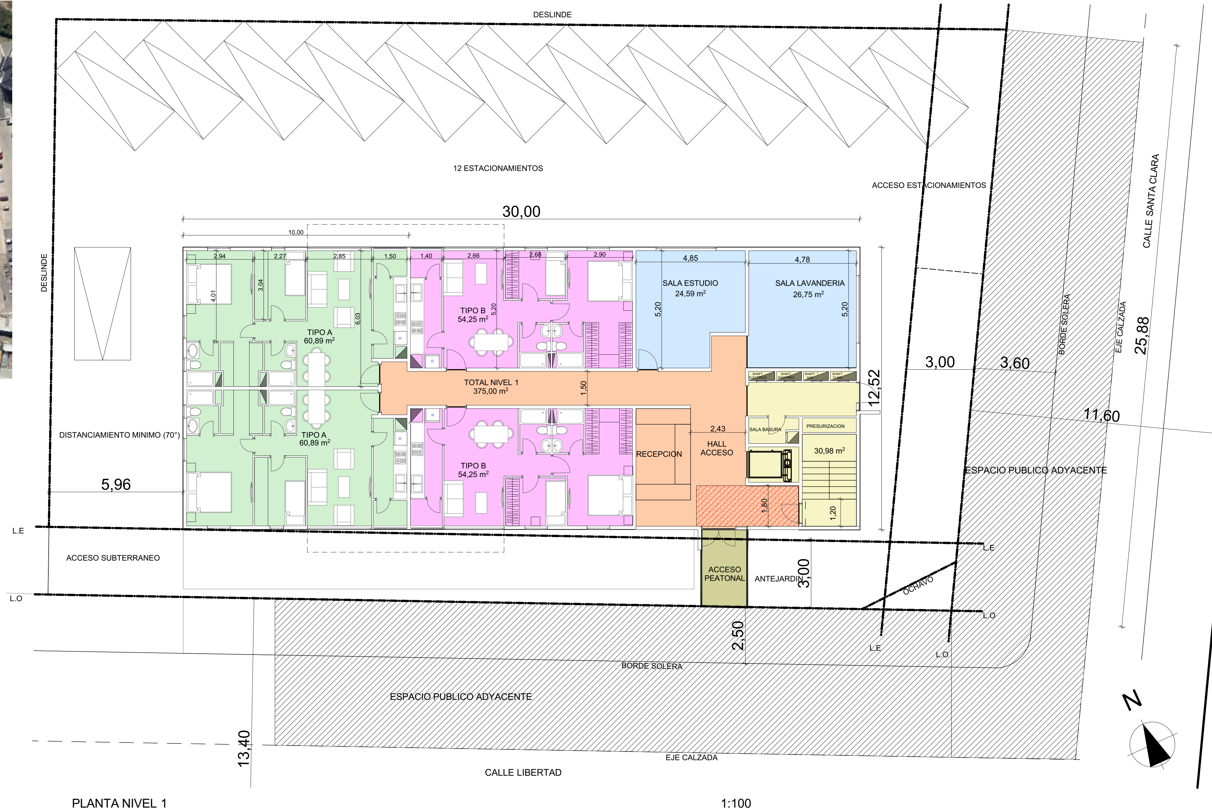
PLANTA NIVEL 1 1:100